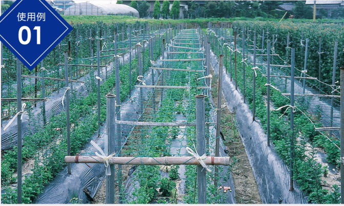
◆菊の倒伏防止（ネットの色部分を加工しています）