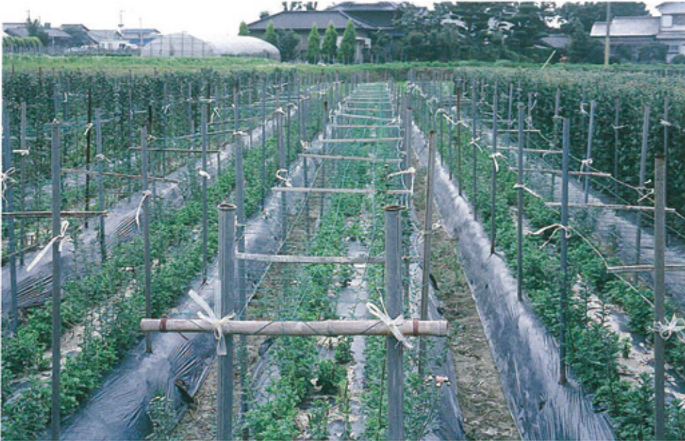
(ネットの色を一部加工しています)